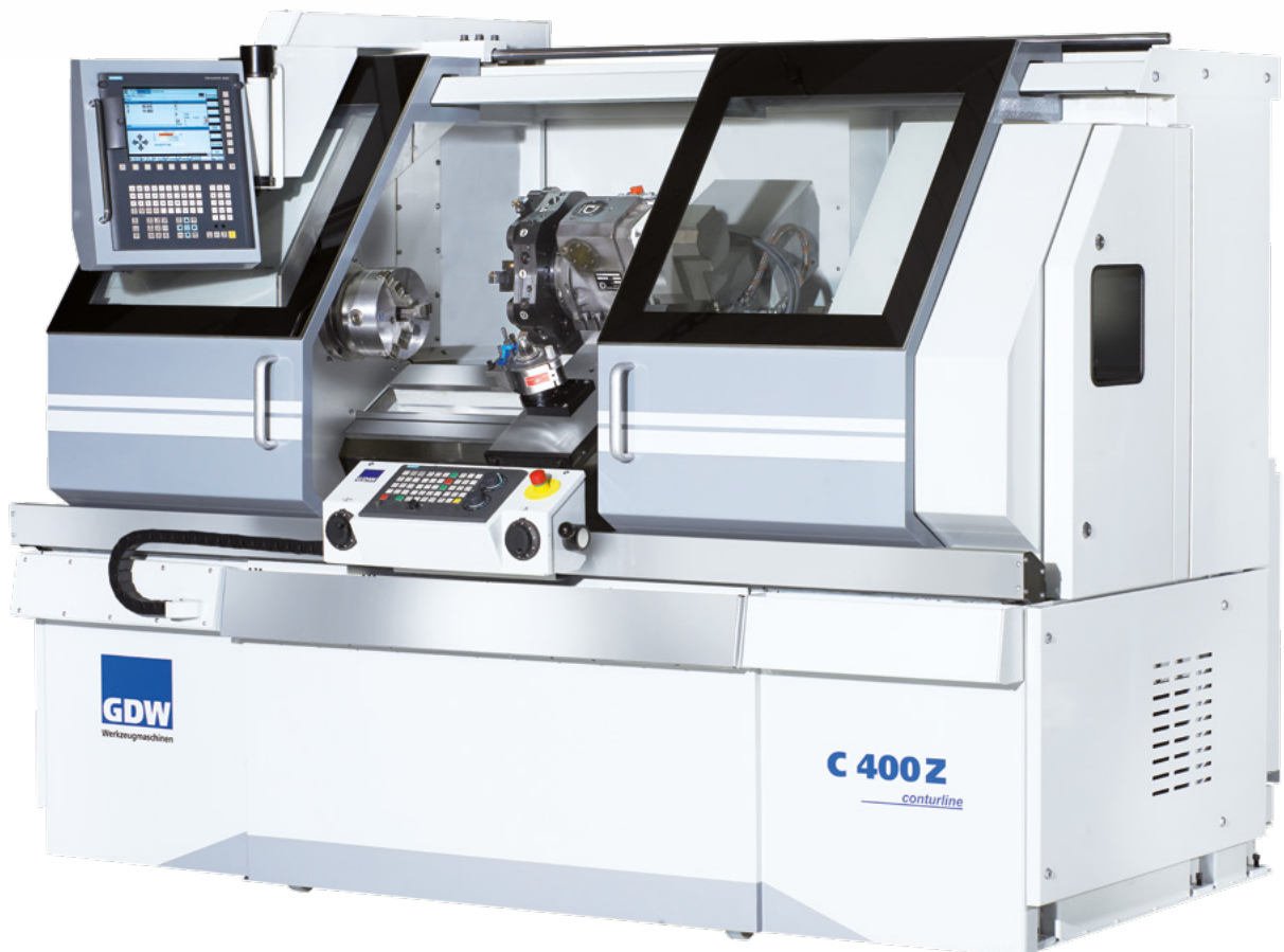
Abbildung mit Sonderausstattung

Ergonomische computerunterstützte Präzisions-Drehmaschine