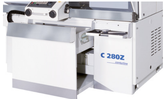
Spänewagen und Werkzeugablage