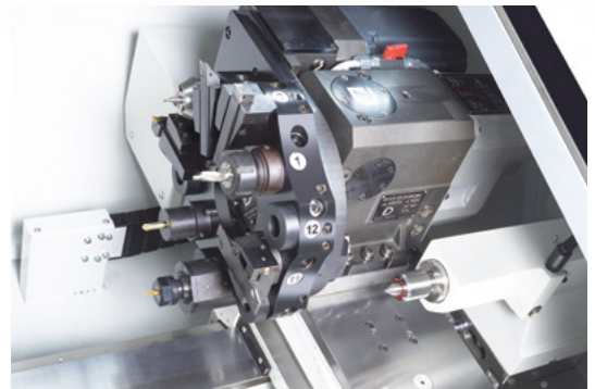
Automatischer 12-fach Werkzeugrevolver