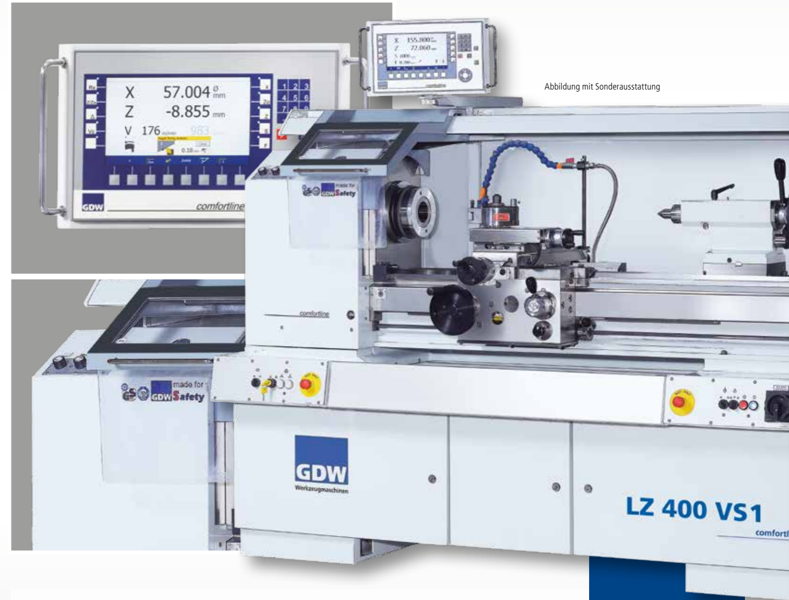
Abbildung mit Sonderausstattung

Produktlinie comfortline LZ 250 VS LZ 280 VS LZ 400 VS1 LZ 400 VS2