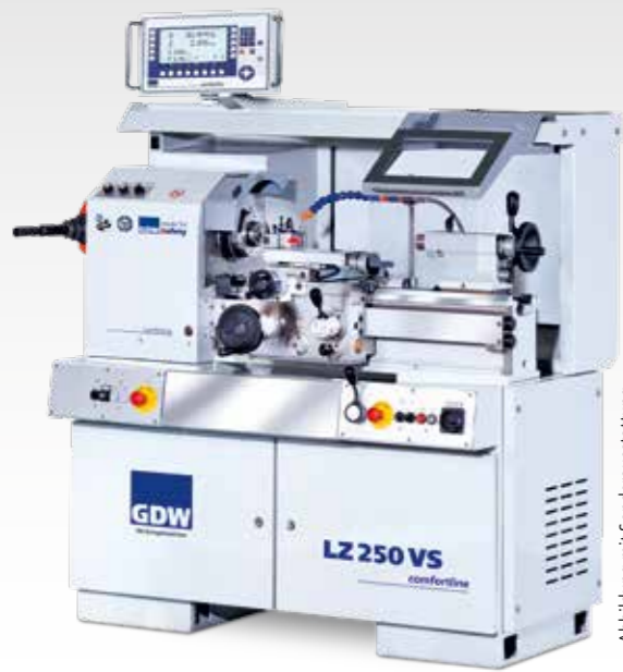
Abbildung mit Sonderausstattung