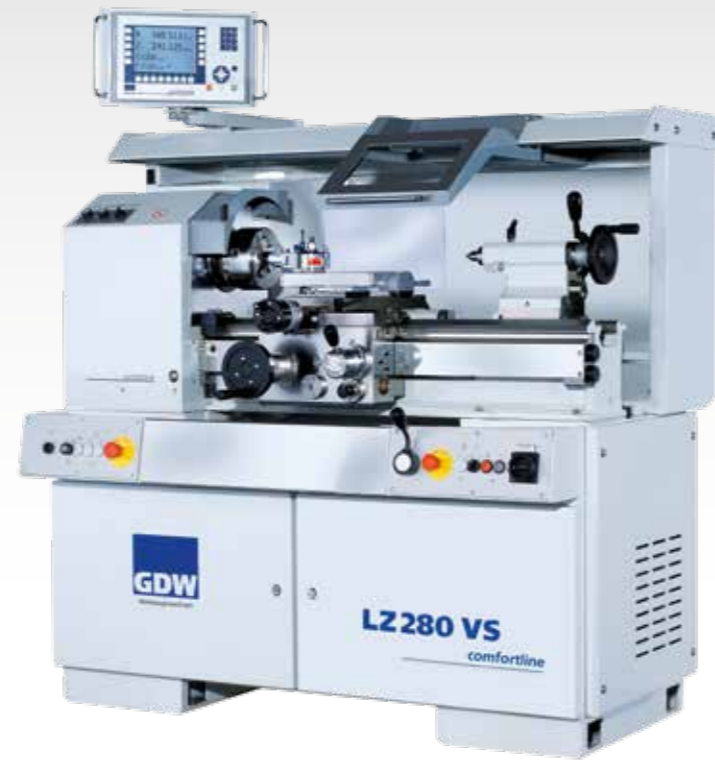
Abbildung mit Sonderausstattung