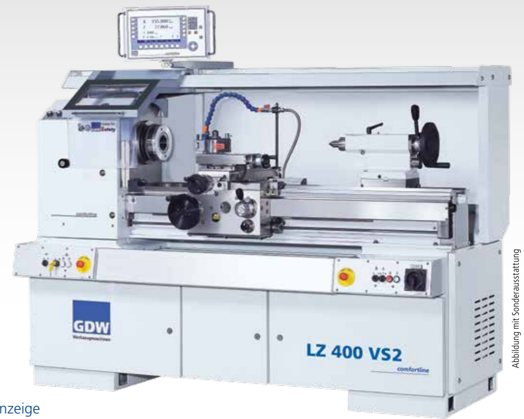
Abbildung mit Sonderausstattung